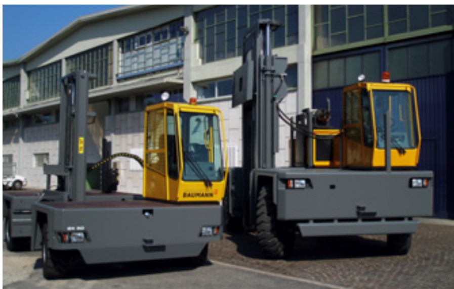
Verbrennungs-Seitenstapler GX 50 (links) neben einem Grossgerät für ein Stahlröhren produzierendes Unternehmen in Deutschland.

Entwicklung am schweizerischen Markt sehr erfreut. Besonders hervorzuheben seien die teils sehr komplexen Einsatzszenarios, mit denen sein Unternehmen konfrontiert werde. Baumann-Geräte findet man in der Holz-, Stahl-, Baustoff- und Kunststoffindustrie. Dort verrichten