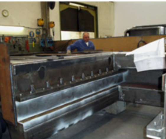
Beeindruckend ist die hohe Fertigungstiefe in der Produktion.